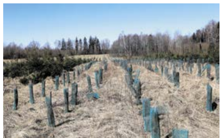
Mišką sodinti skatinama gamtinių ar kitų specifinių kliūčių turinčiose bei nenašiose žemėse.

15 metų), kalėdinės eglutės ir greitai augančių rūšių medžiai, skirti energijai gaminti. Želdinant greitai augančias medžių rūšis, kurių laikotarpis tarp dviejų kirtimų yra nuo 15 iki 20 metų, parama teikiama tik jų įveisimo