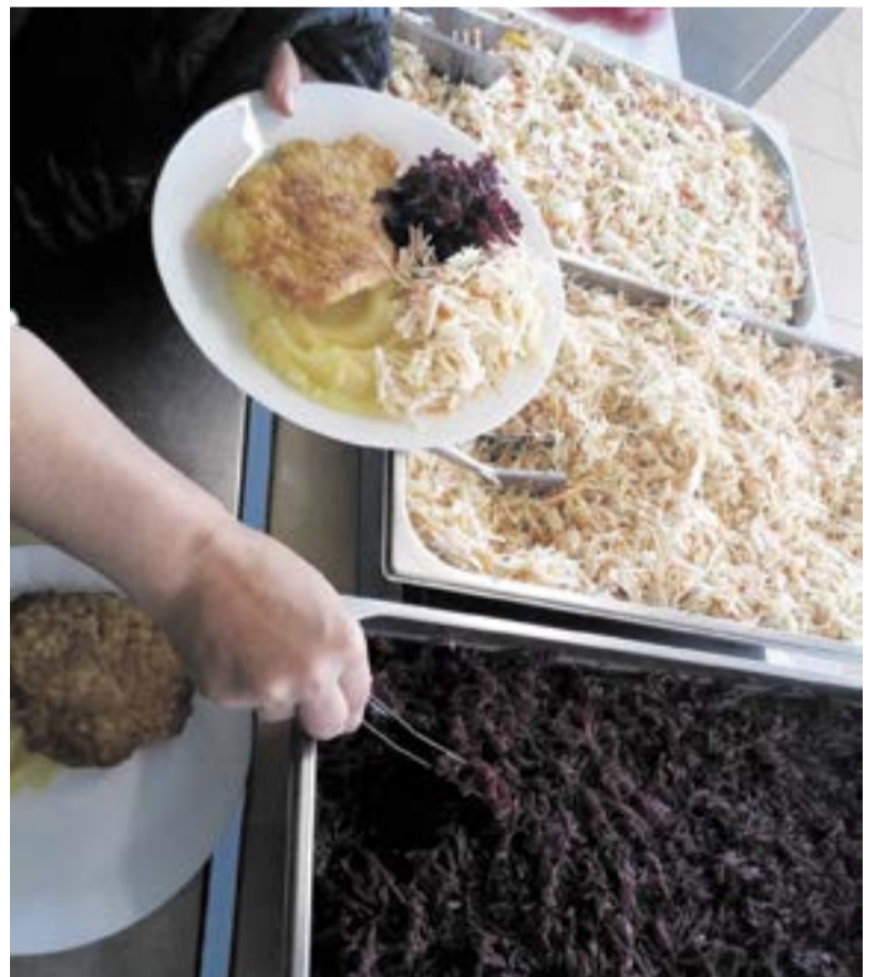
Žalgirių gimnazijos moksleiviai salotų įsideda patys, jų kiekiai neribojami