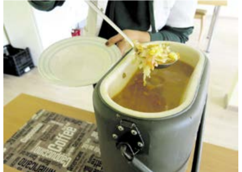
Šaltą dieną skurdžiuosius sušildo dėmesys ir karštos sriubos lėkštė

Drabužius labdarai Tauragės Caritas priima ketvirtadieniais ir penktadieniais nuo 9 iki 12 valandos. Pašnekovė sakė, kad jau seniai norėjo kreiptis į žmones, kurie atneša drabužių labda-