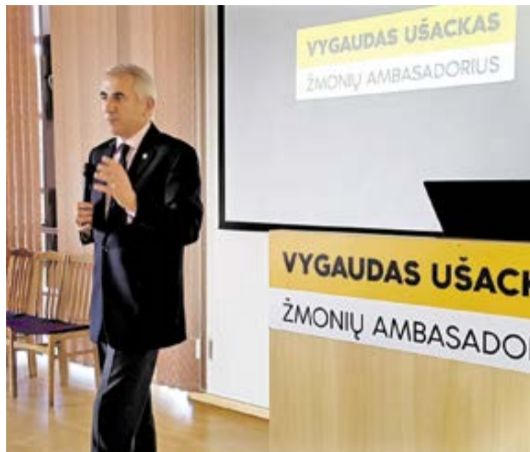
Vygaudas Ušackas, važinėdamas per miestus susitikti su jų gyventojais, prisistato kaip žmonių ambasadorius.

Tauragiškiams ambasadorius parodė aštuonių minučių filmuką apie save. V.Ušacko tėvai – tremtiniai, tremtyje praleidę šešerius metus. Jis pats gimęs Skuode, todėl gerai suprantantis periferijos kasdienybę ir problemas. Iš Skuodo gyvenimas V.Ušacką nubloškė į karščiausius pasaulio taškus, jis tapo pagrindiniu Lietuvos derybininku dėl narystės Europos Sąjungoje, kelerius metus ėjo užsienio reikalų