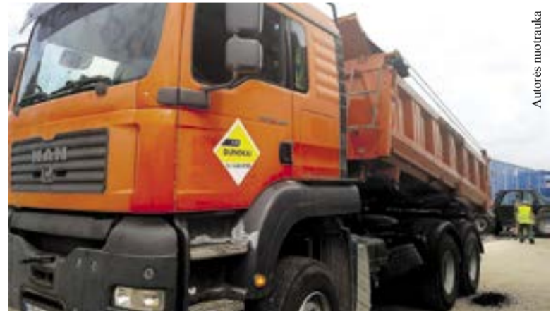
„Dunokų“ akcijos ir įmonės turtas bus bandomas parduoti jau trečią kartą