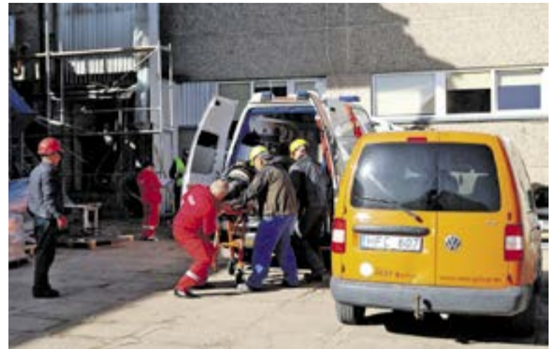
Nuo pastolių nukritęs darbininkas skubiai nuvežtas į ligoninę.