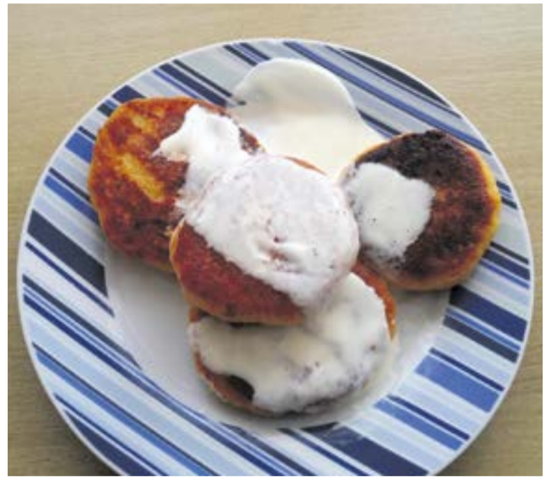
Gardieji PRC varškėčiai kainavo vos 66 centus

Ir iš tikrųjų patiekalų kainos šioje mokymo įstaigoje, kurios valgykloje mokymo tikslais dirba