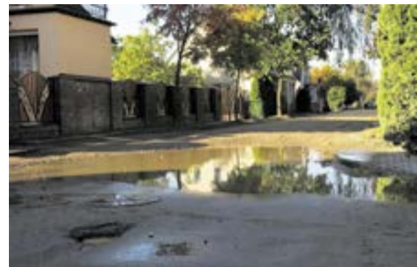
Daugiau nei pusę savaitės nelyja, bet Maironio ir Vizbutų gatvių sankryžoje telkšo bala.