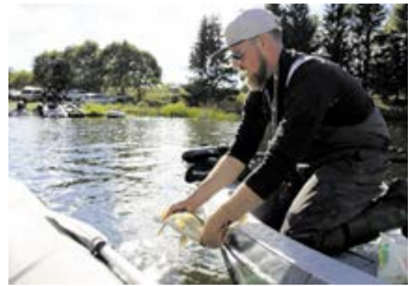
Visos varžybų metu sugautos žuvys buvo paleistos atgal į vandenį

Varžybų organizatoriai džiaugiasi, kad savo jėgų išbandyti atvyko tiek daug žvejų mėgėjų, tarp jų ir – jauniausia dalyvė, vienuolikmetė plungiškė, ir dėkoja rėmėjams – bendrovėms „Zumpė ir Ko“, „Dorima“,