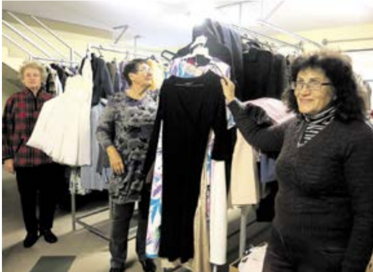
Tauragės Carito patalpose dovanotus drabužius naujam gyvenimui paruošia savanorės