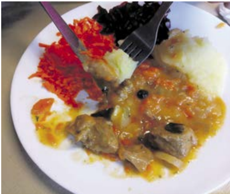
Jovarų pagrindinės mokyklos valgykloje ragauto guliašo porcijoje radome tik keturis gabalėlius mėsos