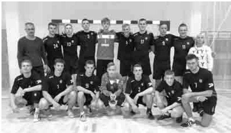
Klubas nusprendė, kad už „Šiltaurą“ žais tik jaunieji Tauragės rankininkai