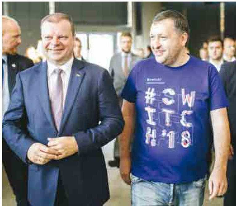
Antanas Guoga pasveikino į renginį atvykusį premjerą Saulių Skvernelį

– Vaikai iš regionų nėra išlepinti pasirinkimo. Vilniečiai,