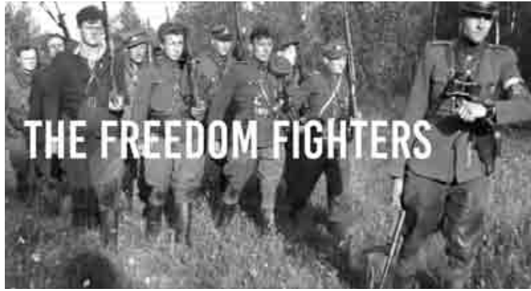
Vaizdo įrašo stopkadras

Filmukas, jau išplatintas „Facebook“, „Youtube“ ir „Twitter“ socialiniuose tinkluose, bus platintas per kitus Užsienio reikalų mi-