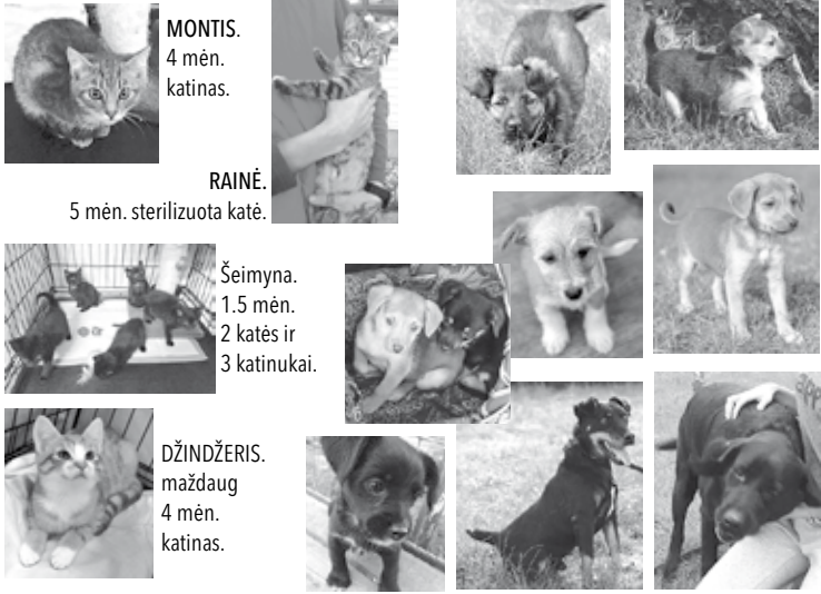
MONTIS. 4 mėn. katinas.

VšĮ „Gyvūnų globa Tauragėje“ ir Lietuvos gyvūnų globos draugijos Tauragės skyrius DOVANOJA šiuos ir kitus šeiminių neturinčius gyvūnus