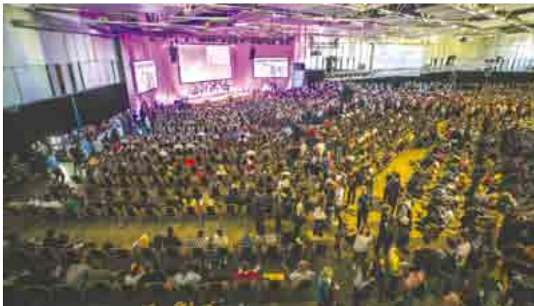
Tūkstančiai jaunų žmonių iš visos Lietuvos atvyko pasisemti motyvacijos, idėjų ir žinių