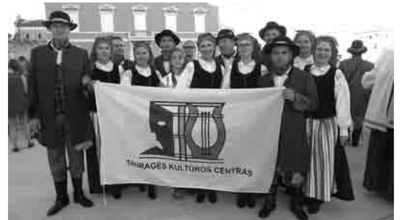
Kolektyvų albumų nuotraukos

Pirmosios vietos diplomą parsivežė ir Tauragės kultūros centro liaudiškų šokių kolektyvas